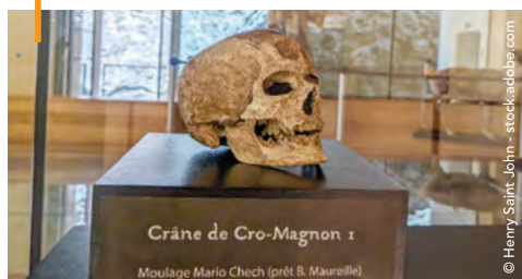
Crâne de Cro-Magnon 1